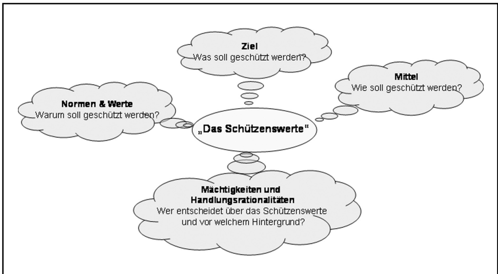
Abbildung 2: Die Fragen nach dem Schützenswerten (eigene Darstellung)

In den Diskussionsprozessen, die in und um den Natur- und Hochwasserschutz geführt werden, tauchen immer wieder Situationen auf, in denen Aussage gegen Aussage steht: „Buhnen und andere Flussbauwerke dienen dem Hochwasserschutz“, sagen die einen. „Nein, ganz im Gegenteil: Buhnen wirken sich bei Hochwasser wasserstandssteigernd