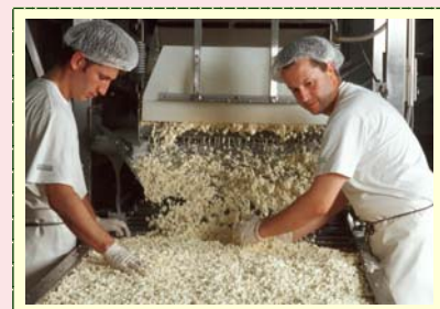
Abb.1: Im Mittelpunkt des Projekts stehen Lebensmittel und ihre Verarbeitung

In den letzten Jahren hat das Angebot an verarbeiteten Bio-Lebensmitteln stark zugenommen. Zu Beginn der Bio-Bewegung in den 1970ern galt ein unverarbeitetes oder nur gering verarbeitetes Lebensmittel als ideal, da es als besonders umweltschonend und soziaerverträglich betrachtet wurde. Im Teilprojekt „Ernährungsökologische Bewertung verarbeiteter Lebensmittel“ wurde der Frage nachgegangen, welche Eigenschaften zukunftsfähige verarbeitete Lebensmittel aufweisen sollen. Zusammen mit VertreterInnen aus Landwirtschaft, Verarbeitung, Handel und Konsum wurde ein Leitbild für ein zukunftsfähiges verarbeitetes Lebensmittel entwickelt.